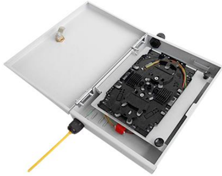
Widok szafki od strony kasety spawów